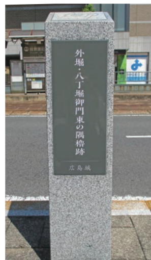
写真2 外堀・八丁堀御門東の隅櫓跡標柱

門は外部からの侵入を防止するために設けられ、隅櫓とともに城郭北東部南の警備の要でした。標柱は現在の広島東税務署（中区上八丁堀）前の歩道にあります。