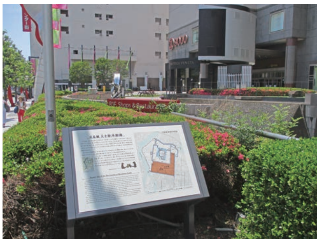
写真1 基町クレド前の大手郭跡説明板

郭（曲輪）とは、堀、土塁や石垣などで囲まれた区域のことで、大手郭は城郭の南東部に位置し、江戸時代には藩の重臣らの屋敷が立ち並んでいました。郭内で行われた発掘調査では、侍屋敷跡・櫓台石垣などが確認され、金箔瓦などが出土しました。説明板は基町クレド（中区基町）の植栽の一角にあります。